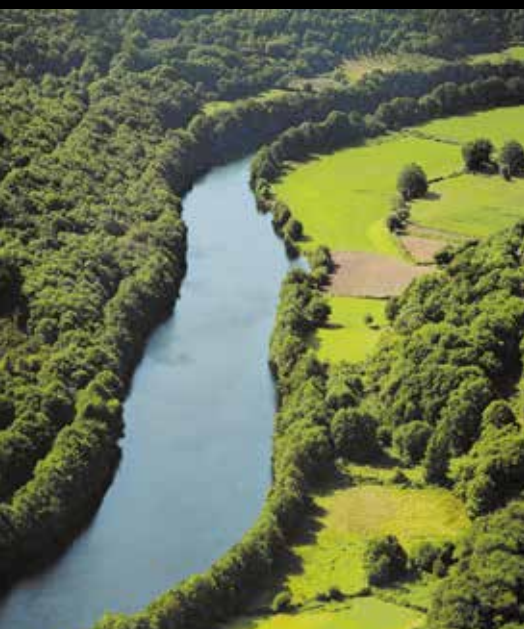
Reserva da Biosfera Terras do Miño