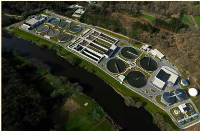
EDAR municipal de Lugo