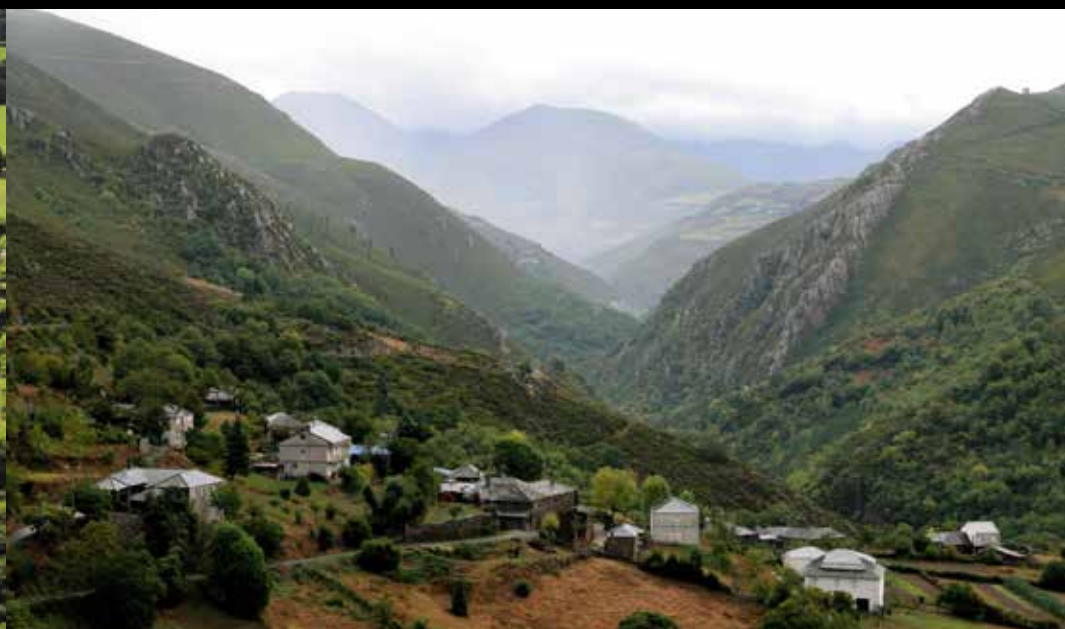
Reserva da Biosfera Os Ancares Lucenses