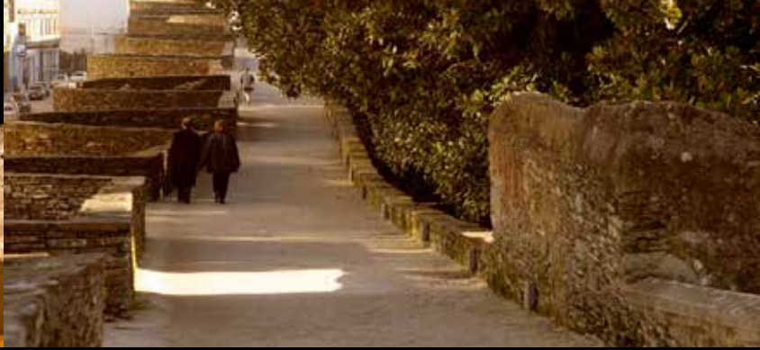
Muralla romana de Lugo (declarada Patrimonio da Humanidade pola UNESCO o 30 de novembro do ano 2000)