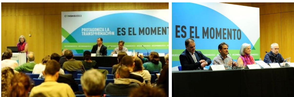
Figura 4: Sesión Técnica ST-26. 2. El bienestar en la ciudad con una mirada One Health.