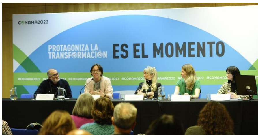
Figura 5: Sesión Técnica ST-26. 2. Salud y equilibrio entre los ecosistemas urbanos.