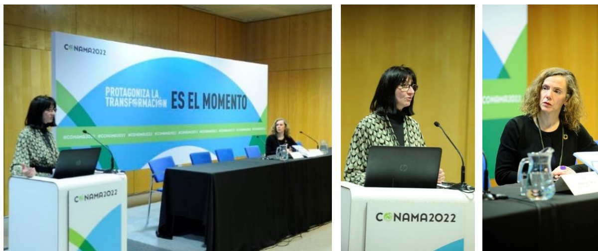
Figura 3: Sesión Técnica ST-26. Introducción.